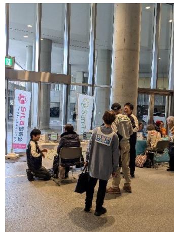
出展ブースの様子

当協議会では、今後も展示会への出展などを通じて、対話型 AI コミュニケーションシステムの普及・促進活動に取り組むとともに、協議会の活動に賛同頂ける会員の募集に努めます。